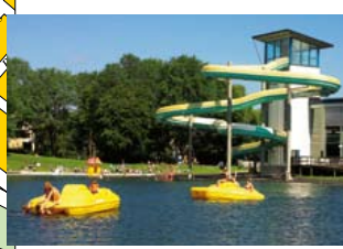
9 Simhallen, Tinnerbäcksbadet