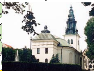
7 S:t Lars kyrkan