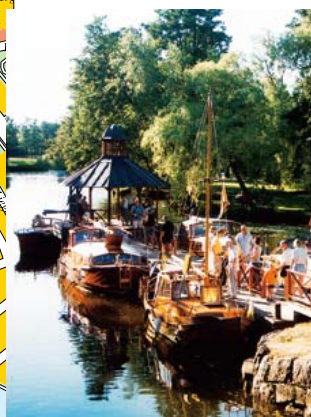
8 Kinda kanal