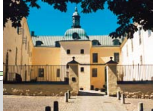
6 Linköpings slott och Domkyrkomuseum