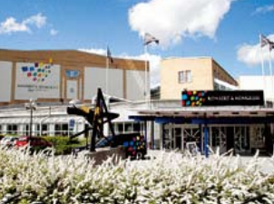
1 Konsert & Kongress