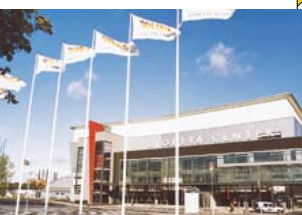
2 Cloetta Center